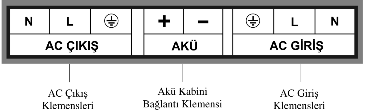
Şekil 1.3 KGK Elektriksel Bağlantı Açıklaması

KGK çıkışına bağlı olan prizlerin diğer prizlerden renk veya yapı olarak farklı olması tavsiye edilir.