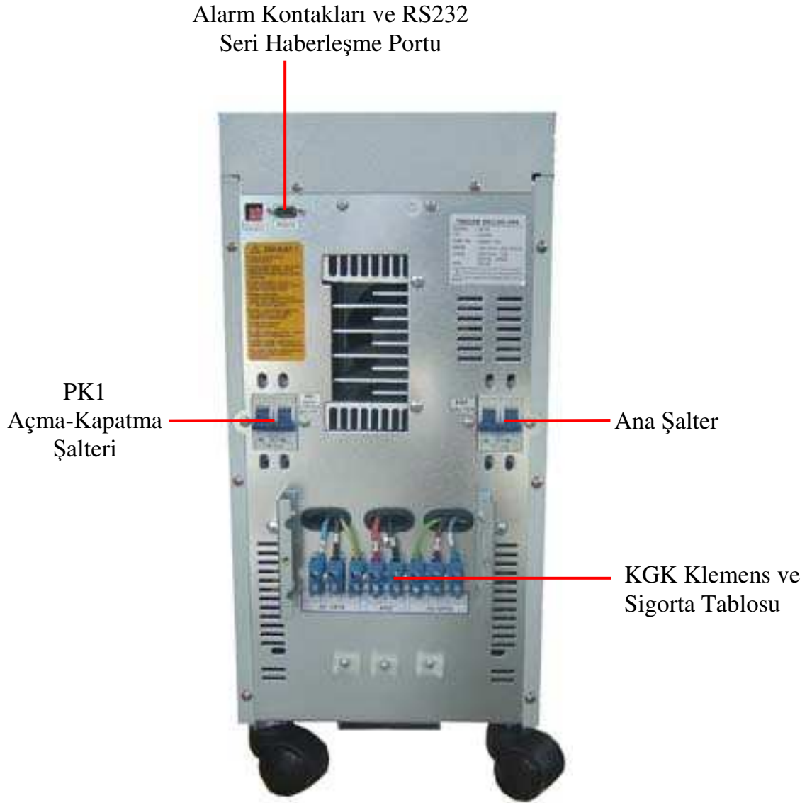
Şekil 1-2 Arka Görünüş