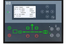
DEIF AGC 150