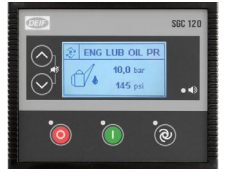
DEIF SGC 120