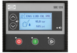
DEIF SGC 120