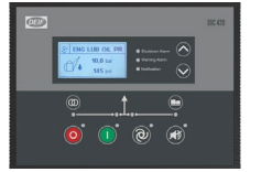
DEIF SGC 420