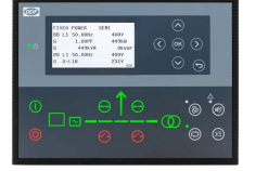
DEIF AGC 150