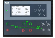
DEIF AGC 150