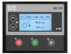
DEIF SGC 120