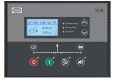
DEIF SGC 420