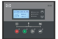
DEIF SGC 420