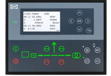
DEIF AGC 150